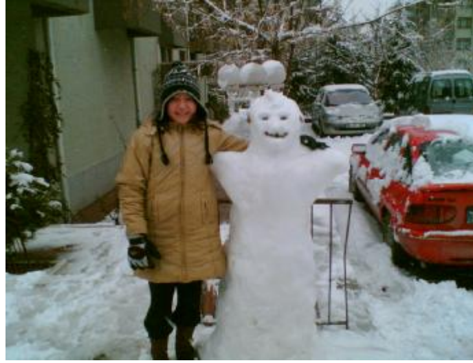
Resim 2 : İnsanın çevresine uyumu onu mutlu eder.

Uyum, bireyin sahip olduğu özelliklerle kendi benliği ve içinde bulunduğu çevresi arasında dengeli bir ilişki kurmasına denir. Yani insanın kendisi ve çevresiyle barışık olması, sağlıklı ilişkiler kurup devam ettirebilmesidir. Çocuğun topluma uyumu sosyalleşme süreci içerisinde gerçekleşir.