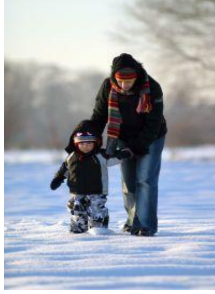
Resim 5: Annenin desteđi çevreye uyumu kolaylaştırır.