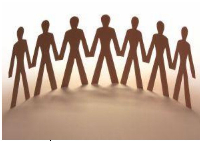
Resim 3: İinde yařađımız toplum uyumu etkiler