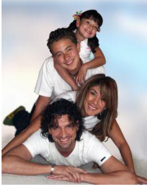
Resim 20:Aile içi sevgi ve dayanışma problemlerin çözümünde etkilidir.

Problem hala devam ediyorsa mutlaka bir uzmandan yardım alınmalıdır. Anne-baba da bu yardımdan faydalanmalıdır.