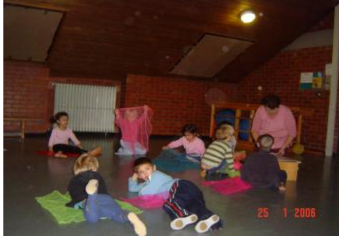
Resim 4: Bir gruba dahil olma psiko-sosyal ihtiyaçlarımızdan biridir.