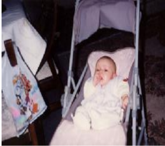
Resim 16: Parmak emme, keşfetme güdüsüyle ilk yıllarda çok görülür.

Bebekler parmak emmeyi zamanla geliştirerek, ayak parmaklarını, oyuncaklarını, battaniyesini, eşyaları sık sık ağızlarına götürmeye başlarlar. Bu davranışlarının nedeni çevreyi tanıma ve keşfetme ihtiyacı olarak kabul edilir.