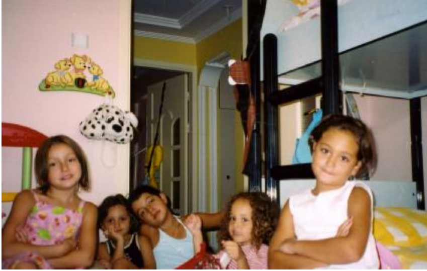
Resim13: Çocuklara barış halinde mutlu yaşamayı öğretmeliyiz.

Çocuk saldırganlaşıyor diye her isteği yapılmamalıdır. Kesinlikle saldırganlığa saldırganlıkla cevap vermemelidir.