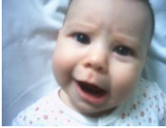
Resim 10: Bebekler öfkelerini ağlayarak belli eder.

Anne babalar için en sıkıcı anlardan biri çocuğun başkalarının yanında öfkelerini çığlık atarak, bağıarak, oyuncaklarını fırlatarak gösterdikleri anlardır. Ara sıra yaşanan öfke nöbetleri, 1-4 yaş arası çocuklarda normaldir. Çocuk, zamanla kendini ifade etmeye başladığında davranışlarını da kontrol etmeye alışacaktır.