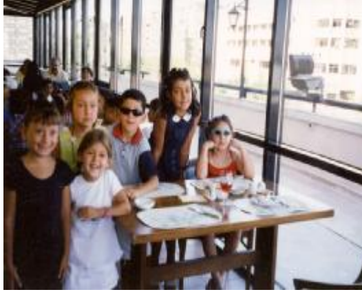
Resim 1: Uyum her yaşta önemlidir.

“Ülkenin birinde bilge bir kral varmış. Ülkesinde herkesin mutlu yaşadığı bu bilge krala, bir gün kötü bir haber iletmışler. Krala düşman olan bir büyücü, ülkenin bütün su kaynaklarına ve kuyularına büyü su katmış. Sudan içen herkes bir bir delirmiş.