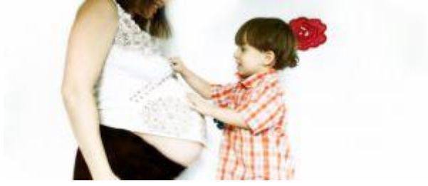
Resim 14:Yeni bir kardeş fikrine çocuk alıştırmalıdır.

Kardeşini kıskanan çocukta, mızımızlanma, bebek gibi konuşma, meme emmek isteme, altını ıslatma gibi gerileme davranışları görülebilir. Yine çocuk sürekli “Uykum geldi”, “Karnım acıktı”, “Çişim var” gibi sözlerle anne-babayı rahatsız edip ilgiyi kendine çekmeye çalışır. Devamlı olarak huzursuzluk duyar ve çevresindekileri de huzursuz eder. Basit nedenlerle öfkelenir, eşyalarına zarar verir, nedensiz ağlar.