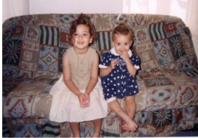
Resim18: Tırnak yeme nadiren 2-3 yaşlarında da görülebilir.

Tırnak yeme davranışı, 4-5 yaşlarından itibaren görülmeye başlar. Nadiren daha küçük yaşlarda da görülebilir. Okul çağında tırnak yeme en yoğun şekilde görülür.