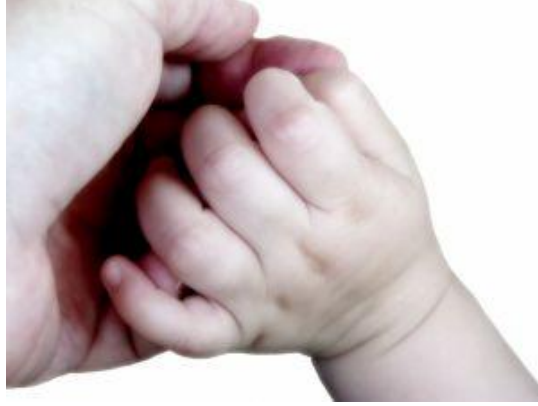
Resim 6: Sevgi her problemi çözer

Yansıtma, bastırma, gerileme gibi savunma mekanizmalarına da zaman zaman başvurur. Çocuğun temel ihtiyaçları zamanında karşılanarak, tutarlı ve demokratik bir eğitimle çocukta kaygı oluşumu önlenir. Ayrıca geleneksel çocuk yetiştirme yöntemlerimizin bağımlılığı artırıcı, girişkenliği kısıtlayıcı olduğunu unutmadan bu yöntemlerden vazgeçilmelidir. Çocuk anne babanın bir uzantısı değil kendi başına bağımsız bir bireydir. Kaygı çok şiddetli ve sürekli ise mutlaka uzman birinden yardım alınmalıdır.