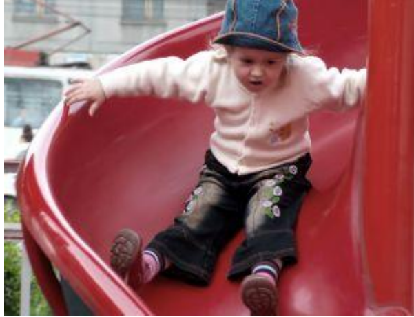
Resim 12: Çocuklar sevdikleri faaliyeti sürdürmede inat ederler.

Kabul edilmesi gereken çok önemli noktalardan biri, çocuğun aile büyüğünden farklı duyup, farklı görüp, farklı algılayıp, farklı düşündüğüdür. Bu yüzden çocuğun yetişkinlerden farklı olan düşüncelerine saygı göstermeli gereksiz inat davranışları göstererek çocuğa yanlış model olunmamalıdır.