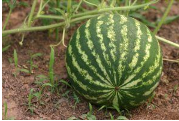
Resim 8: Canavar karpuz bahçede

Bir zamanlar, her yerden uzak bir köyde yaşayan insanların büyük bir korkuları varmış. Bu insanları korkutan yakın çevrede bulunan canavarlarmış. Aslında canavar diye korktukları büyük karpuzlarmış. Köyde kimse karpuzun ne olduğunu bilmiyormuş. Herkes karpuzlarla ilgili korkunç hikâyeler anlatıyor, böylece karpuzlar giderek daha çok korkutucu hale geliyormuş. Kimse karpuzların yanına gitmeye cesaret edemiyormuş. Gel zaman, git zaman, karpuzun ne olduğunu bilen bir yabancıнын yolu bu köye düşmüş. Bakmış ki bütün köylüler karpuzlardan korkuyor, bundan yararlanmak istemiş. Bütün köylüleri yanına toplamış ve onları bu beladan kurtaracağını söylemiş. Bir bıçak almış, halktan kendini izlemelerini istemiş. Canavarların yanına giderek onları parçalamış, kanlarını akıtmış, hatta onları bir güzel yemiş. Bu olay halk arasında hemen yayılmış. Halk canavarlardan kurtulduğuna seviniyormuş ama bu kezde de bir canavarı bile yiyen, gaddar ve zalim yabancından daha fazla korkmaya başlamış.