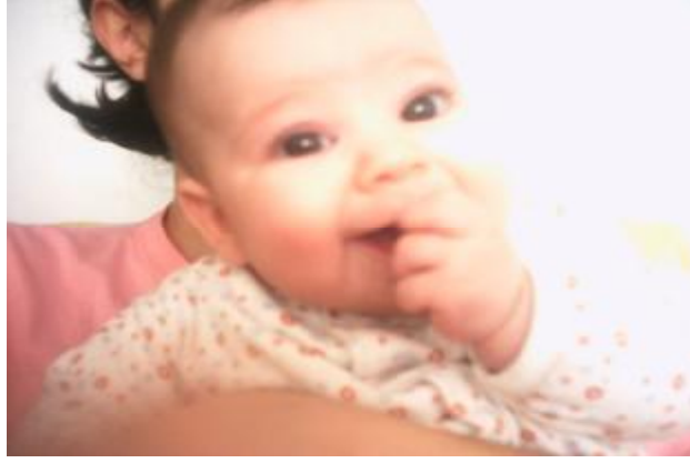
Resim 17: 0-1 yaş dönemi ağızdan zevk alma dönemidir.

Çocuklar kendi sorunları ile başa çıkmada yetişkinler kadar güçlü değildir. Korku, açlık, anneden ayrılma ya da uykuya dalma sırasında parmak emme, dudakları ile oynama veya dudak ısırma, koparma davranışları gösterebilirler. Örneğin; kreşe başlamış on bir aylık bir bebek anneden ayrı kalmanın verdiği korku ve endişe ile parmak emme davranışını sıklaştırabilir. İleriki yaşlarda parmak emme davranışı, boşanmalar, anne-babadan birinin ölümü, babanın ya da annenin uzun süre evden uzakta kalışı, kaygı, kıskançlık gibi nedenlerden kaynaklanabilir.