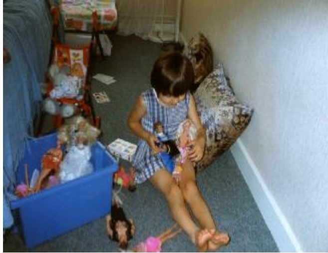
Resim 19: Okulöncesi dönemde çocuk, hayali oyunlar oynar, hayali yalanlar söyler.

Altı yaşından küçük çocuklar, gerçekte hayali birbirinden ayırt edemedikleri için bu yaşa kadar söylenen yalanlar davranış bozukluğu olarak düşünülmez. Evde yalnız başına evcilik oynarken boş koltuklarda misafir varmış gibi onlarla konuşan, “Kiminle oynuyorsun” sorusuna “Arkadaşlarım var bak onlarla oynuyorum” diyen dört yaşındaki bir çocuk hayali oyunlar oynar ve hayali yalanlar söyler. Bu, onun gelişimsel özelliğidir. Okul öncesi dönemde gerçeklik ve kurgu arasında bir sınır yoktur. Bu yüzden çocuğun her söylediği yalan olarak değerlendirilmemelidir.