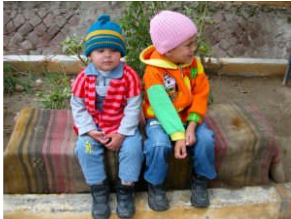
Resim 4: Çocuklar öğrendiklerinin büyük bir kısmını taklitle öğrenirler

Ailenin çocuk üzerindeki tutumu çocuğun diğer çocuklarla arkadaşlığının olumlu ya da olumsuz yönüne eğilim göstermesine neden olur. Sevgi dolu bir ailede büyüyen çocuklar çevrelerindeki insanlarla kavga etmeden iletişim kuracaklardır. Şiddetin görüldüğü ailede yetişen çocuklar kavgacı olacaklardır. Sevgi gören çocuk sevmeyi, şiddet gören çocuk kavgayı öğrenir.