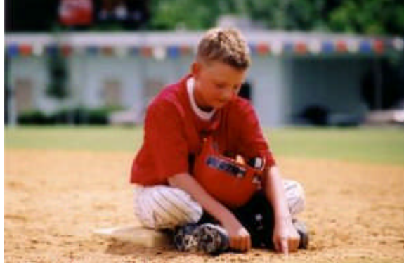
Resim 6: Rekabeti kıskançlık boyutuna taşımamak gerekir