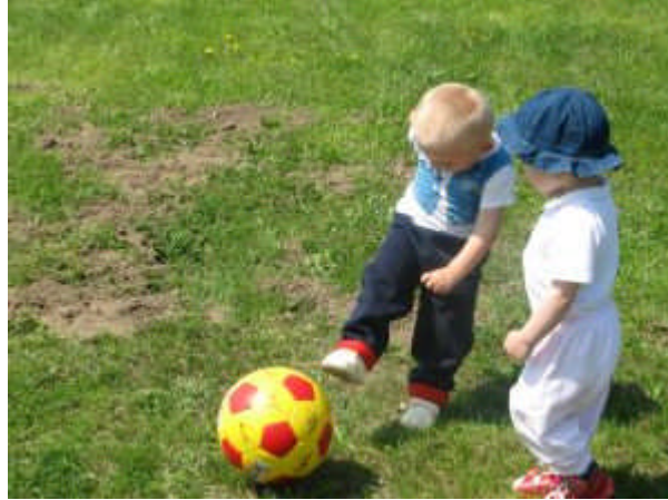
Resim 5: İşbirliği oyunla başlar

Erken çocuklukta, oynadığı oyunun kurallarına uyan, arkadaşlarının hakkına saygı duyan çocuk, büyüdüğünde toplum kurallarına uyan sosyal bir insan olacaktır.