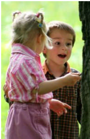
Resim 7: Kız erkek ilişkisi

9-11 yaşları arasında kız-erkek arkadaşlığı yeni bir boyut kazanır. Bu dönemde kızlar kendi cinsleriyle erkeklerde kendi cinsleriyle arkadaşlık kurarlar. Kesinlikle karşı cinsi oyunlarına almazlar. Kızlar erkekleri acımasız ve kaba görürler. Kızlar ve erkekler birbirini asla çekemez ve aşağılar. Bu durum ergenlik çağına kadar devam eder.