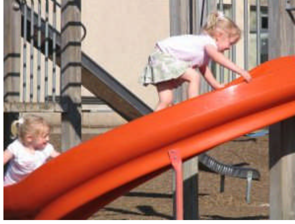
Resim 3: Gruba katılma