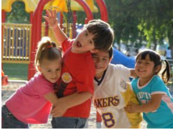
Resim 2: Arkadaş edinme