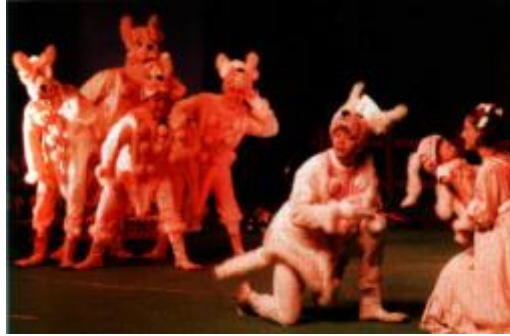
Forograf 1.2: Drama,kişiler arasında doğrudan iletişimi sağlar

Drama;kişiler arasında doğrudan iletişimi sağlayan; kendini ve karşısındakini tanıma, birbirini anlama, doğaçlama ve yaratma gibi etkinlikleri içeren bir yöntemdir.