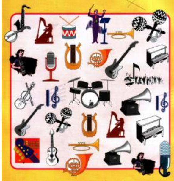
Şekil 3.1: Müzik araçları ile bir oyun oluşturulabilir

Katılımcının karakter portresine ve etkinliğin özelliğine göre müzik seçilmeli ve teknik donanımla desteklenmelidir. Örneğin, duygusal durumlarda klasik veya romantik, heyecan varsa hızlı ritimli, coşku varsa ritmik, koro sesleri içeren müzikler seçilebilir.