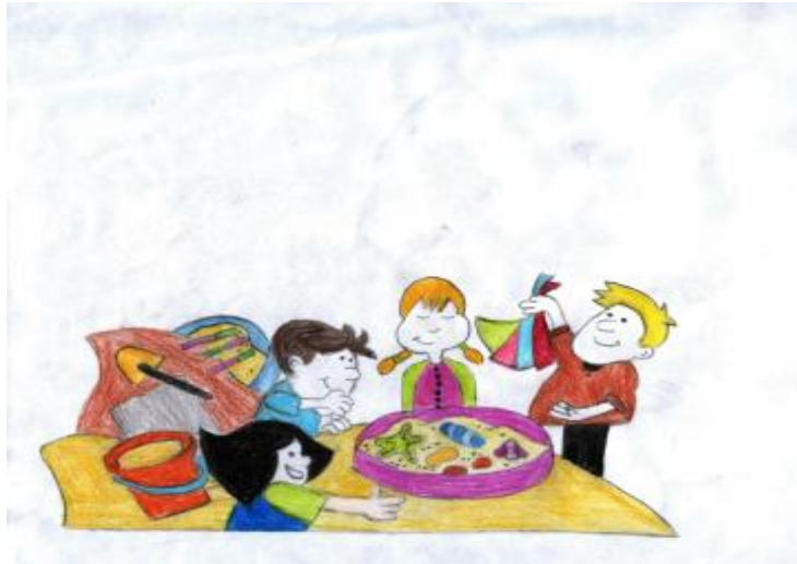
Şekil 2.1 : Yaratıcı drama çalışmalarında isteyerek grupta yer almak önemlidir

Doğaçlamalardan oluşan yaratıcı drama katılımcıların kendi yaratıcı düşünceleri ile buldukları, özgün düşünce yapılarının ürünleri, hatırladıkları yaşama dair birikimleri ve bilgileri önceden yazılmış bir metin olmadan uygulanır. Yaratıcı drama etkili eğitimde yaşayarak öğrenmeyi sağlayan yaşamsal bir faktördür.