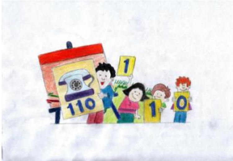
Şekil 2. 3: .Dramada her etkinliğin bir amacı olmalıdır

Eğitimde drama; bir sözcüğü, bir kavramı, bir davranışı, bir cümleyi, bir düşüncüyü, bir yaşantıyı ya da olayı tiyatro tekniklerinden yararlanarak, oyun veya oyunlar geliştirerek canlandırmaktır.