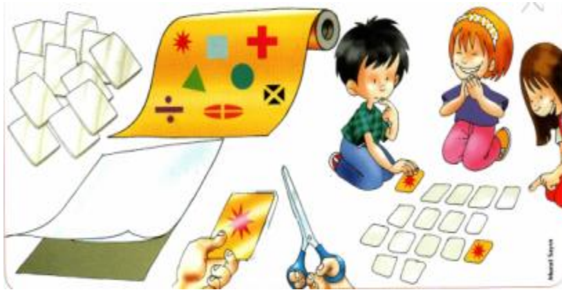
Şekil 2.2: Drama çalışmalarında öğrenciler sınıfta öğrenmeye açık hale gelirler

Kendini ifade etme, özgüven duygusu geliştirme, psiko-motor, zihin dil yönünden gelişim sağlama, empati kurarak çok yönlü düşünebilme, iş birliği, dayanışma, paylaşım gibi duyguların gelişimi, eğitim ve öğretimde olumlu rol oynama, rahatlama, öğrenilen bilgilerin kalıcı olabilmesi, olaylara ve durumlara farklı bakış açılarına sahip olma, demokratik ortamlar oluşturarak tartışma eleştirme ve eleştirilere açık olmayı öğrenmesini sağlayan bir süreçtir.