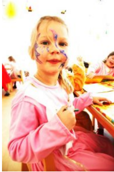
Fotoğraf 1.1: Her insan az ya da çok yaratıcılık yetisine sahiptir

Yaratıcı düşünce için yalnızca sanat ya da müzik alanlarını düşünmek ölçüt değildir. Yaratıcı düşünce beş duyunun ve zekânın bileşiminden oluşur. İnsan yaşamındaki tecrübeler, çocukluktan başlamak üzere oynanan oyunlar yaratıcı düşüncenin her yerde karşılaşılabilecek bir süreç olduğunu gösterir.