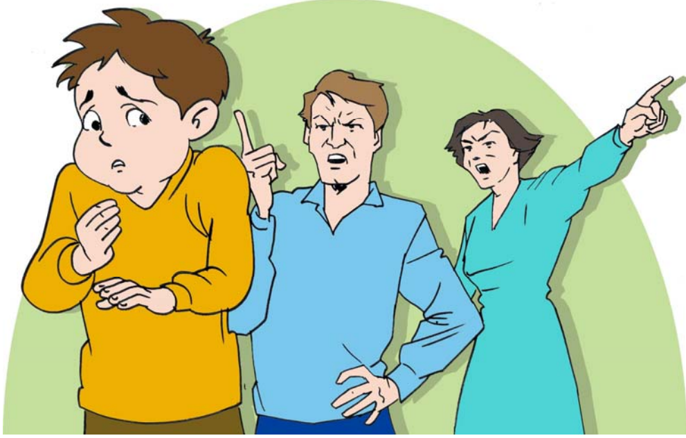
Şekil 1.3:Ailenin, çocuğun yaratıcı fikirlerini hayata geçirmesine fırsat vermemesi yaratıcılığını olumsuz etkiler.