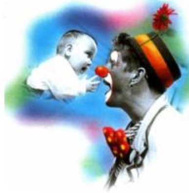
Resim 2.2: İletişimde bireyler etki alışverişinde bulunmaktadır

Yaratıcı drama çalışmalarında ortaya koyulan tüm ürünler paylaşılmaktadır. Bu çalışmaların özünde birlikte üretme ve paylaşma isteği bulunmaktadır. Bu istek katılımcıların ve izleyicilerin bir arada olacağı bir ortamda gerçekleştirilir. Bu durumda bir iletişimin oluşması olasıdır. İzleyiciler gerçek anlamda izleyici değildirler. Öte yandan bu izleyiciler görmek iştirmek isteyeceklerdir. Bu noktada katılımcılar iştirmeyi, görülmeyi, kendilerini net bir şekilde anlamaları gerektiğini kısaca iletişim gerçeğini öğreneceklerdir. İletişim her yaratıcı drama çalışmasını izleyen tartışma da doğal olarak ortaya çıkacaktır. Yaratıcı dramada çocuklar iletişim kurma becerilerini kazanmakta ve geliştirmektedirler. Çocuklar bu etkinlik içinde düşünme, konuşma, dinleme, anlatma becerilerini de kazanmaktadır.