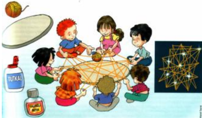
Şekil 1.2 :Çocuklar algıladığı, çağrışımlarla bulduğu simgeleri ve birçok imgeyi oyunlarda kullanır

Oyunla başlayan yaratıcı düşünce oyuncaklar, dil gelişimine uygun etkinliklerle daha da belirgin hale gelir. Oyunlar aracılığı ile gözlemediği her rolü deneyebilir. Algıladığı, çağrışımlarla bulduğu simgeleri ve birçok imgeyi oyunlarda kullanır. Küçük yaşlarda başlayarak aldığı, çağrışım ve bellek yoluyla oluşturduğu imgeler on üç yaşına doğru en yüksek noktaya ulaşır. Bu, yaratıcı düşünce için en verimli dönemdir. Bu durumun erken oluşmasında çevresel faktörlerin ve eğitimin rolü büyüktür.