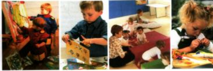
Fotoğraf 3.1: İlgî köşeleri yaratıcı drama için uygun bir ortamdır

Örnek Çalışma: Sınıf ortamında erken çocukluk eğitim kurumlarında bulunan ilgi köşeleri gibi yaratıcı drama ortamı oluşturacak şekilde bir köşe düzenleyiniz.