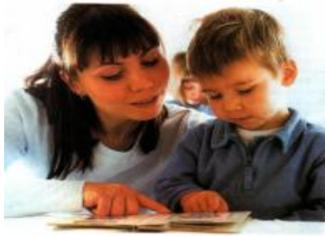
Fotoğraf2.1: Aile ,çocuğun yaratıcı orijinal cevaplarını ödüllendirmeli ve yeni denemeler için cesaretlendirmelidir.