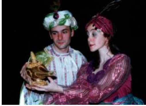
Fotoğraf 1.3: Drama hayal gücünü kullanmayı ve doğaçlamalarla anında eğitimi sağlar