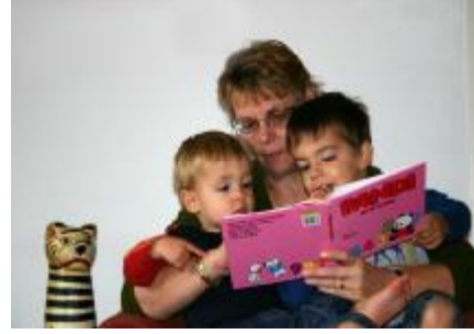
Resim 13 : Çocuğa kitap okunabilir