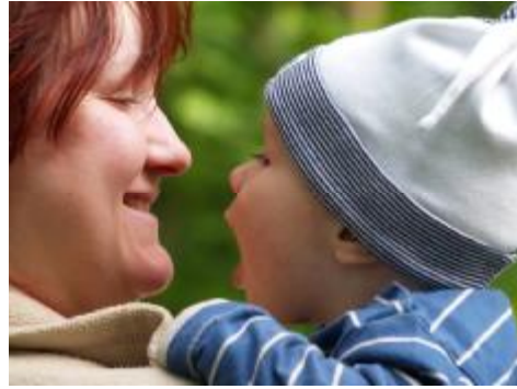
Resim 12 : Çocuğun konuşmaya teşvik edilmesi gerekir.

Çevre ve özellikle anne tarafından çocuğa sunulan sözel uyaran zenginliği dil gelişimini olumlu etkiler. Yetişkinlerle uzun süre birlikte olan çocuk düzgün konuşur. Bakımevlerinde büyüyen çocuklar, aile içinde büyüyen çocuklara oranla daha çok ağlarlar; fakat daha az hecelerler. Bunları, konuşmayı daha geç öğrenirler. Bu sonuca göre kişisel ilişkiler, dil gelişimi için önemli bir etkidir. Aile bireyleri özellikle anne ile çocuk arasındaki sağlıklı ilişkiler, dil gelişimini olumlu etkiler. Bu konuda ailenin genişliği de önemlidir. Ailede tek olan çocuk daha çabuk ve düzgün konuşur, çünkü ailenin ilgi merkezidir. Çocuğun konuşmaya teşvik edilmesi, cevap vermeye cesaretlendirilmesi dil gelişimi için önemlidir. Çocukla konuşmak, oyun oynamak, kitap okumak dil gelişimini destekler. Çocukların çevresindeki kişilerle yaptığı konuşmalar, onun dil gelişimi için önemlidir. Yetişkinlerle sürdürülen çocuklar soru cevap alışverişleri, çocuğun bilmediği dil yapılarını öğrenmesine olanak sağlar.