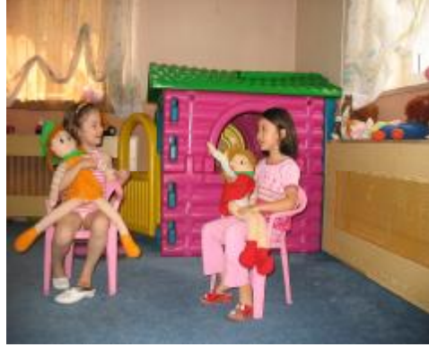
Resim10: 6 yaşındaki çocuğun dil kullanımı

5-6 yaşındaki çocuğun, dili kullanımı bir yetişkin diline benzer. Sosyal etkileşimde konuşma artar ve anlaşılır biçimde olduğu görülür. Çocuk, yetişkini daha az taklit eder. Çekim kuralları ve kişi zamirlerinin çekimi de doğru kullanılır. Çocuk, 5 yaşına geldiğinde olayları sırasına göre anlatır. “Elimi yıkadım ve yemeğimi yedim” gibi. Olayları “önce-sonra”, “sırasına dizme”; geçmiş, şimdiki, gelecek” zamanı kullanımı gelişir. Çocuk, 5 sözcük içeren cümleler kurabilir. Çocuklar 6-7 yaşlarında birlikte yaşadıkları yetişkin gibi konuşurlar. Sözcük sayısı ortalama 2000 kadardır. 8 yaşına geldiğinde sözcük sayısı 3000’e ulaşır. Bu yaştan sonra dinleme süresi artar. Yaşadıkları olayları mantıklı bir şekilde anlatırlar. Telaffuzları düzgün, kelimeleri çeşitlidir.