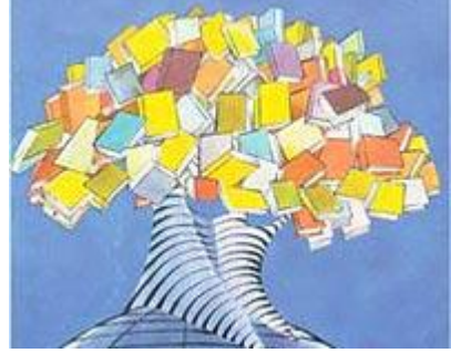
Resim 15 : Resimli kitaplar