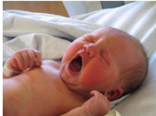
Resim 2 : Yeni doğan dönemi (ağlama)

Ağlama, bebeğin ihtiyaç ve isteklerini belirten ilk tek iletişim yoludur. 1. ayın sonunda anne, sesin farklılığına göre ağlamanın nedenini (açlık, kızgınlık, acı) belirleyebilir. Çıkarılan sesler, anlam yönünden incelendiğinde ham sözcüklerin başladığı; bebeğin başkalarının sesine tepki gösterdiği dönem olduğu görülür.