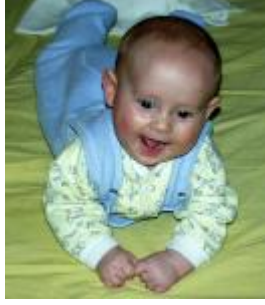
Resim 5 : 6-9 aylar, mırıldanmanın tekrarı dönemi görülür.

Bebeğin çıkardığı sesler, anlam yönünden incelendiğinde dikkati çekme, sosyalleşme için kullanıldığı, hoşnutluk verici bir durum veya nesne hatırlandığında sesin yeniden ortaya çıktığı görülür. Bebeğin, insan konuşmasına gülümseyerek veya ses çıkararak cevap verdiği ayrıca kızgınlık ve hoşnutluk seslerini ayırt ettiği görülür.