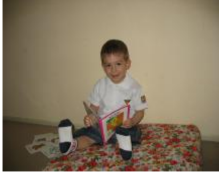
Resim 9 : Kitaplar çocuğun sözcük hazinesini geliştirir.

Çocuk soru sormak, istek ve emirlerini bildirmek için ses tonunu değiştirmektedir. “Anne ceket” ifadesinde ses tonu değişikliği ile çocuk “Anne bu ceket mi?” sorusunu sorabilir. 2-3 yaş çocuklarının cümleleri çok açık; fakat gramer yönünden eksik olabilir. Üç sözcüklü birleşimlerde zaman ekleri, sıfatlar, zamirler, edatlar ve çekim ekleri yoktur. Bu dönemdeki üç sözcüklü birleşimler ya yeniden birleştirme (anne at + top at = baba top at ) ya da genişletme (büyük kalem = çok büyük kalem) şeklinde olur. Çocuk, çok sözcüklü cümleler yaparken dilin temel yapılarını da öğrenir. Çocuğun basit düzeyde de olsa işaret sıfatlarını, işaret zamirlerini, zarfları, olumsuz yapıları soru yapılarını, çekim eklerini kullanmaya başladığı görülür.