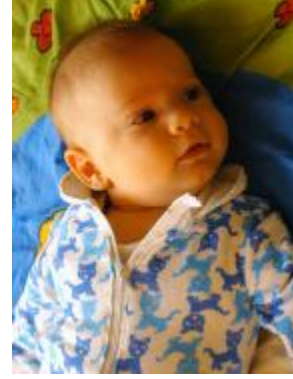
Resim 4 :3-6 ay mırıldanma

Mırıldanmanın tekrarı dönemi , 6-9 aylar arasında görülür. Bu dönem, ses oyunlarının tekrarı dönemi olarak da ifade edilir. Bebek, ses üretimi ile işitmeyi birleştirir. Seçilmiş işitilen sesleri tekrarlar. Mırıldanmanın tekrarının görülmemesi, bu dönemde dil problemlerinin, işitme kaybı, zihinsel gerilik gibi durumların ortaya çıktığını gösterir. Bebeğin ağız hareketlerinde çeşitlilik görülür. Bebeğin çıkardığı sesler, hece tekrarına dönüşerek daha çok çevredeki dilin niteliklerini kazanır. Önceleri p, b, d gibi dudaksı ve diş eti patlamalı sesler çoğunluktadır. Ünlü ünsüz birleşimlerinin tekrarıyla “ba-ba-ba” , “de-de-de” “ma-ma-ma” şeklinde görülür. Bu dönemde çocuk, değişik sesler çıkarır. Çocuklar kelime söyleyene kadar, çocukla beraber bu seslerin tekrar edilmesi teşvik edicidir. Bu dönemde çocuk, bütün ses mekanizmasını serbestçe hareket ettirmeyi öğrenir. Bebeğin ses oyunlarında ritim kullandığı görülür.