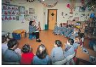
Resim 17 : Türkçe dil etkinliği