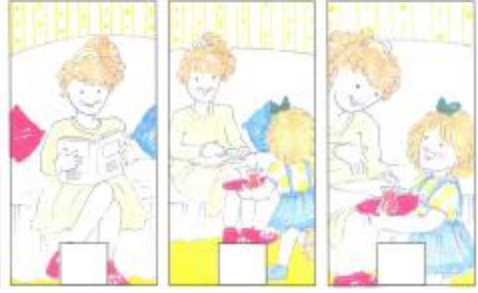
Resim 19 : Resimde anlatılan olaylardan bir hikâye oluşturunuz.

Yönerge: Her sırada bir olay anlatılıyor. Doğru sıraya uygun olaylardan hikâye oluştur.