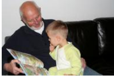
Resim 11 : Dil kazanımı ve çevre

Çevre ve özellikle anne tarafından çocuğa sunulan sözel uyaran zenginliği dil gelişimini olumlu etkiler. Yetişkinlerle uzun süre birlikte olan çocuk düzgün konuşur. Bakımevlerinde büyüyen çocuklar, aile içinde büyüyen çocuklara oranla daha çok ağlarlar; fakat daha az hecelerler. Bunları, konuşmayı daha geç öğrenirler. Bu sonuca göre kişisel ilişkiler, dil gelişimi için önemli bir etkidir. Aile bireyleri özellikle anne ile çocuk arasındaki sağlıklı ilişkiler, dil gelişimini olumlu etkiler. Bu konuda ailenin genişliği de önemlidir. Ailede tek olan çocuk daha çabuk ve düzgün konuşur, çünkü ailenin ilgi merkezidir. Çocuğun konuşmaya teşvik edilmesi, cevap vermeye cesaretlendirilmesi dil gelişimi için önemlidir. Çocukla konuşmak, oyun oynamak, kitap okumak dil gelişimini destekler. Çocukların çevresindeki kişilerle yaptığı konuşmalar, onun dil gelişimi için önemlidir. Yetişkinlerle sürdürülen çocuklar soru cevap alışverişleri, çocuğun bilmediği dil yapılarını öğrenmesine olanak sağlar.