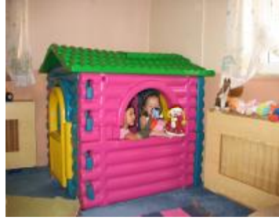
Resim 18 : Kukla Sahnesinde hikâye oluşturma

Hikâye sonrası etkinlik: Çocuklara masal kahramanlarına uygun kostüm giydirilerek dramatize yapmaları istenebilir. Çocuklardan kukla tiyatrosu ile hikâyenin bir başka şeklini oluşturması ve oynatması istenebilir. Maske kullanmak da hikâyeyi canlandırmada etkili bir yoldur. Böylece çocukların Türkçedeki ekleri doğru olarak kullanma, nesne durum ya da olayı anlaşılır bir şekilde açıklama, aynı anlama gelebilecek düşünceleri farklı cümlelerle açıklama becerilerini geliştirmeleri sağlanabilir.