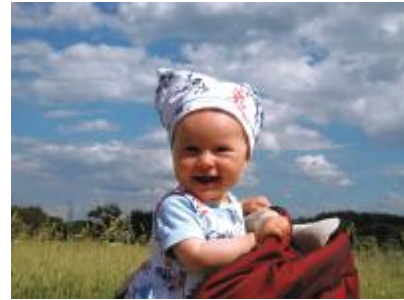
Resim6 : Ses, sözcük dönemi

Ø Ses Sözcük Dönemi , 9-12 aylar arasında görülür. Bu dönem, tekrarlama ya da çeşitlenmiş mırıldanma dönemi olarak da ifade edilir. İnsan seslerini bilinçli bir şekilde taklit eder. Çocuğun sık sık mırıldanarak yetişkin konuşmasına benzeyen dizeler oluşturduğu görülür. Bu sesler anlamdan yoksun, akıcılık özelliği olan, düz cümle ya da soruya benzeyen acele mırıltı şeklindedir. Bu anlaşılma konuşmalara, jargon denilmektedir. Mırıldanmalar, çocuk için sözcük yerini tutar. Dil bilimcilerin, ilk sözcüğün söylendiği bir yaş civarını genellikle dilin başlama noktası olarak kabul ettiği görülür. Bu dönemde çocuk, birkaç jesti ve sözcüğü anlar. Bu aşamadan sonra bebekler, artık anlamları araştırmaya kendi dillerini öğrenmeye hazır durumdadır.