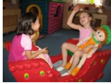
Resim 1 : Heyecan ve duyguları ifade eder.