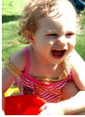
Resim 7 : Tek sözcük dönemi